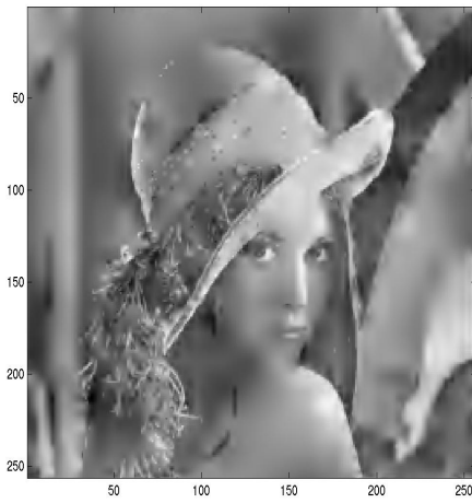
3.6 %; n = 2383