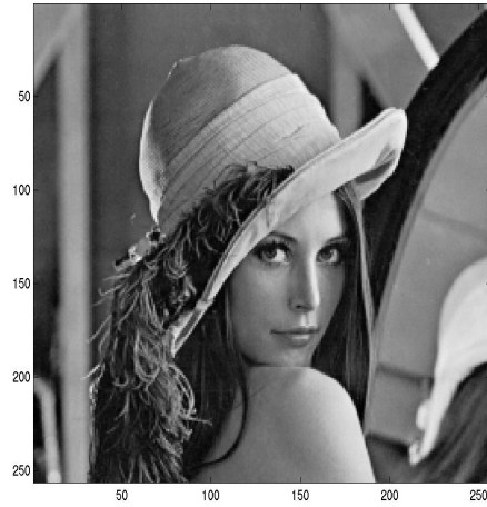
Komprimierte Bilder (Reduktion auf p %; n Koeffizienten \neq 0 )