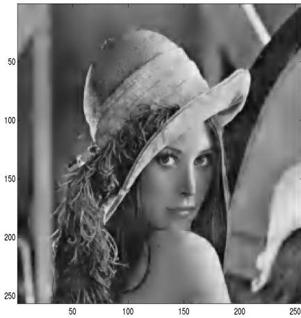
10.0 %; n = 6160