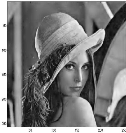
20 %; n = 12378