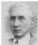
Francesco Paolo Cantelli